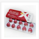
FILDENA EXTRA POWER-150 MG €26.00