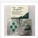
SUPER LEEFORCE €14.50