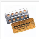
SNOVITRA-20 MG €26.00